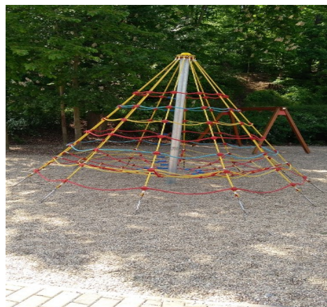
Lanová pyramida pro děti 3 – 14 let max 12 osob