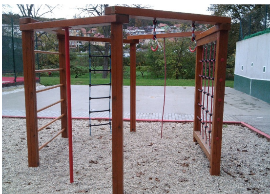
Lezecký šestiúhelník pro děti od 3 let