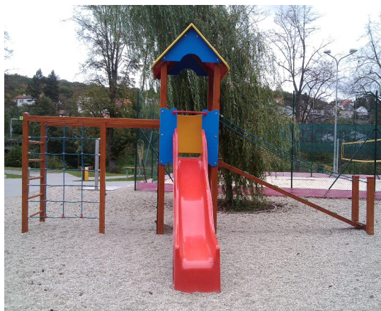
Herní prvek se skluzavkou a lezeckými prvky pro děti 4 – 13 let