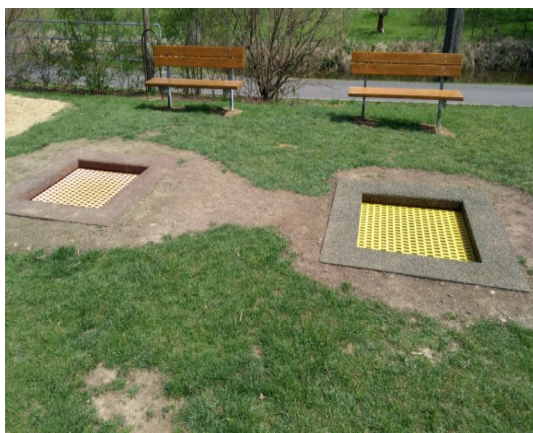
Trampolína pro děti od 3 let pro 1 osobu do 130 kg