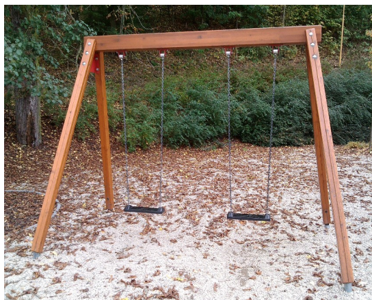
Závěsná houpačka pro děti 3 – 14 let