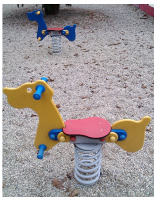
Pružinová houpadla pro děti 2 – 8 let