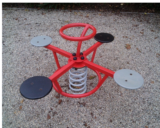
Pružinové houpadlo čtyřmístné pro děti 3 – 8 let

Služby města Náměště n. O., s.r.o. středisko správa sportovišť Ocmanická 200, 675 71 Náměšť n. O. IČO: 262 70 447, DIČ: CZ 262 70 447 tel.: +420 774 938 758 spravce@sportvnamesti.cz www.sportvnamesti.cz