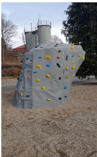
Lezecký kámen 2,5 m - maximální počet lezců využívající kámen současně je stanoven na 4 osoby - lezení je možné pouze na vlastní nebezpečí lezce - sestup je možné řešit seskokem na v tu chvíli volné dopadiště, nebo slezením lehčími částmi balvanu

Služby města Náměště n. O., s.r.o. středisko správa sportovišť Ocmanická 200, 675 71 Náměšť n. O. IČO: 262 70 447, DIČ: CZ 262 70 447 tel.: +420 774 938 758 spravce@sportvnamesti.cz www.sportvnamesti.cz